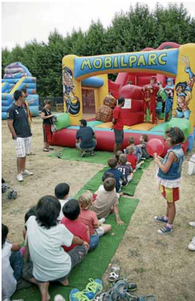
Un dels inflables instal·lats l'any passat

S'utilitzaran milers de gots commemoratius del festival, grocs i amb el lema Catalunya