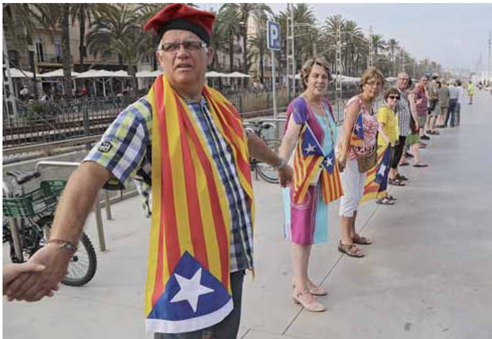
Participants a la cadena humana que el 27 de juliol va unir Sant Adrià de Besos i Montgat.

tasar Garzón va ordenar la detenció de més de quaranta persones en una operació preventiva de gran càrrega ideològica. Llavors, la ciutadania també va respondre massivament a la convocatòria del concert, organitzat per primer cop sota el lema Catalunya vol viure en llibertat . L'any passat, es va organitzar la segona edició del festival, que va reunir de nou cap a quinze mil persones i un munt d'artistes a la Devesa de Girona, en una gran jornada reivindicativa i festiva. Va ser la gran prèvia de la gran manifestació que l'Onze de Setembre va reunir cap a dos milions de persones als carrers de Barcelona.