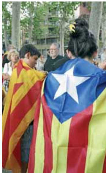
Actuacions musicals, fira de productes de la terra i activitats infantils en l'edició del 2012

Santa Espina . Una hora més tard, a 2/4 de 7, està prevista la hissada de la bandera estelada, cinc metres sobre l'escenari,, mentre Poble que Canta interpreta El cant de la senyera .