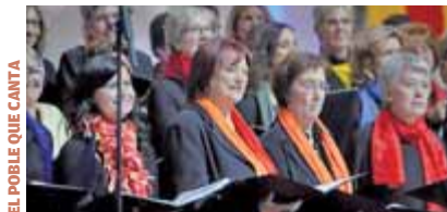
EL POBLE QUE CANTA