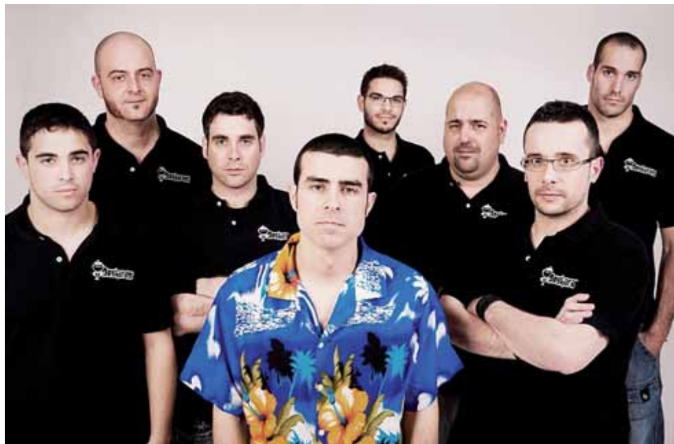
El grup amerenc de 'ska' Deskarats