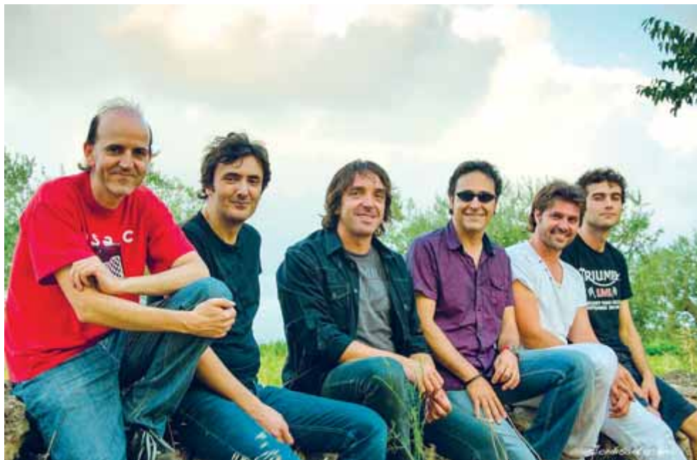
La formació actual de Lax'n'Busto que actuarà al concert de la Devesa de Girona