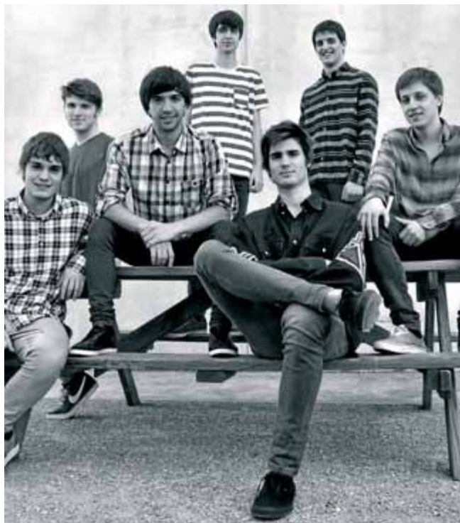
Els set membres d'Acció són empordanesos