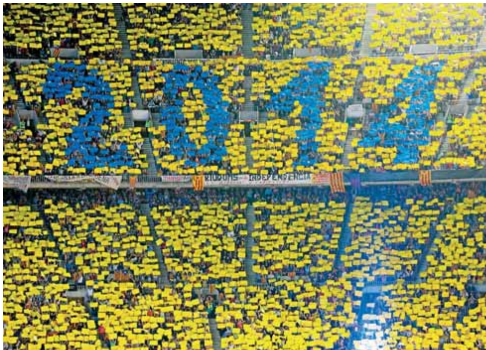
El 2014 del gran mosaic que, patrocinat per El Punt Avui, es va fer al Camp Nou el 29 de juny