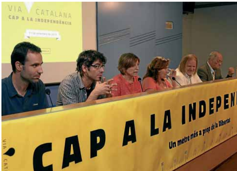
Els organitzadors de la cadena, en la seva presentació a Barcelona el 19 de juny passat

es muntin activitats paral·leles en els 86 municipis per on passa. Tots tenen un coordinador local amb la idea que la jornada esdevingui del tot festiva i es pugui passar com una excursió en família o amb amics. S'ha demanat a tothom que hi vagi amb samarretes grogues, encara millor si són les que es comercialitzen en un lot que inclou una banderola identificativa del tram assignat i un ad-