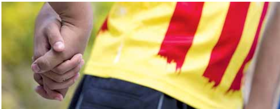
Un detall de la cadena humana que es va fer a Montblanc aquest juliol.