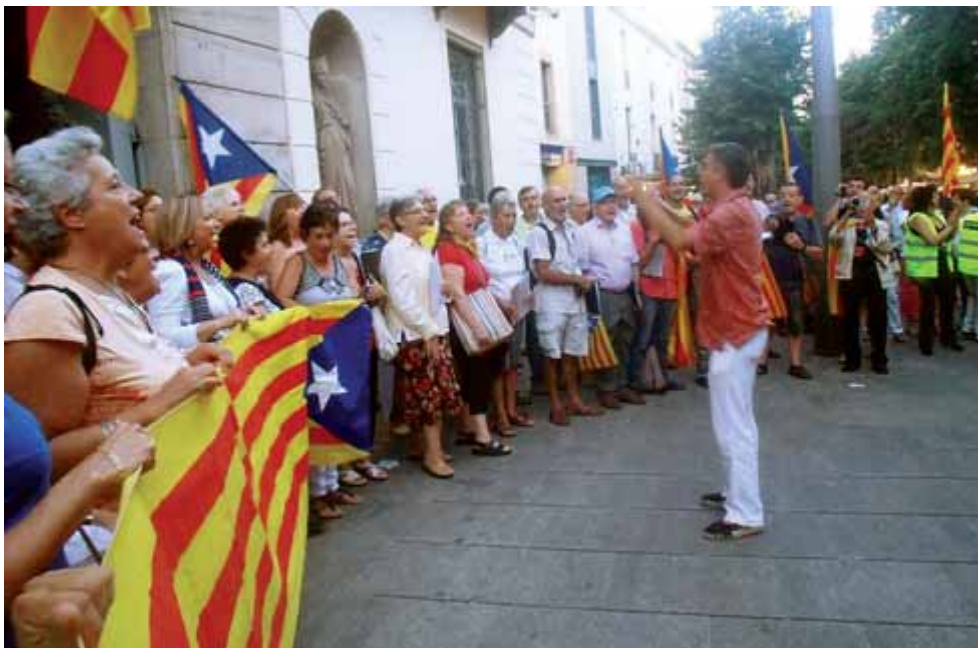
Els membres de la coral Poble que Canta, en una actuació a Mataró