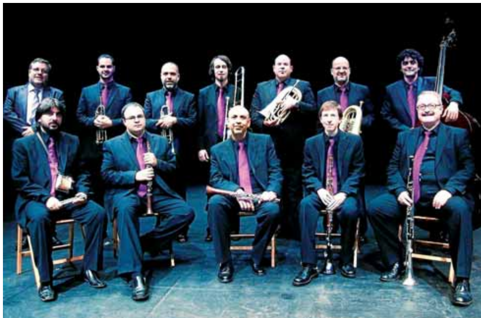
La Cobla Ciutat de Girona oferirà una ballada de sardanes al parc de la Devesa de Girona