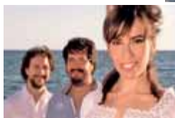
LA PORTA DELS SOMNIS