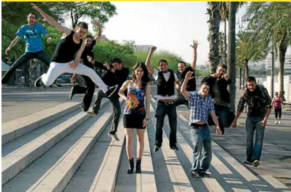
El grup de rumba i salsa 9SON, en una imatge recent