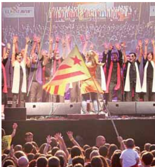
Un moment del festival de l'any passat

És el triomf de la societat civil. Catalunya batega i als seus pobles i ciutats s'organitzen centenars, milers d'actes festius, reivindicatius i divulgatius en una mateixa direcció. I és important no afliuixar. Aquest cop és el carrer qui marca el full de ruta de la classe política i, per primer cop en molts anys, els catalans tenim la sensació que el futur és a les nostres mans. Que el podem forçar, que el podem tombar, que el podem conduir i que el somni es pot convertir en realitat. És per això que El Punt Avui hi torna; perquè volem formar part de la història i perquè no ens podem quedar quietos davant les enormes expectatives