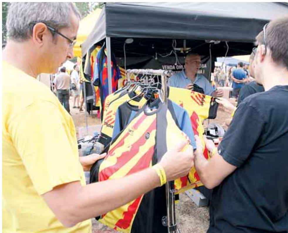
Una de les parades del festival de l'any passat