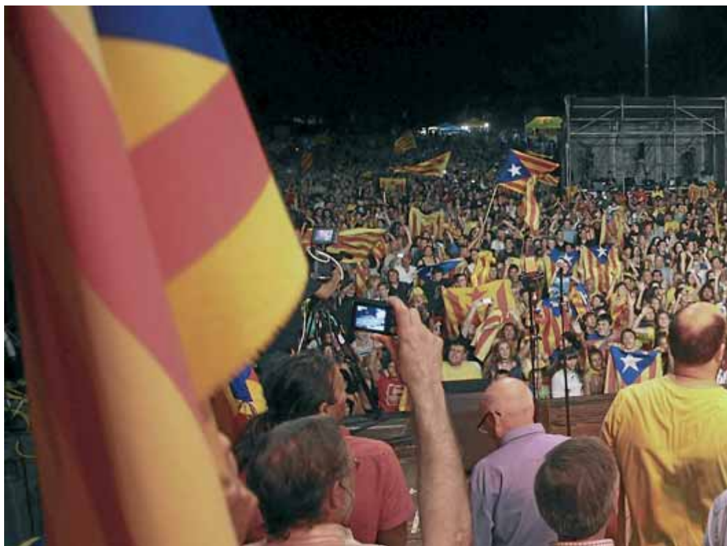
Imatge de la festa concert a la Devesa, el juliol del 2012