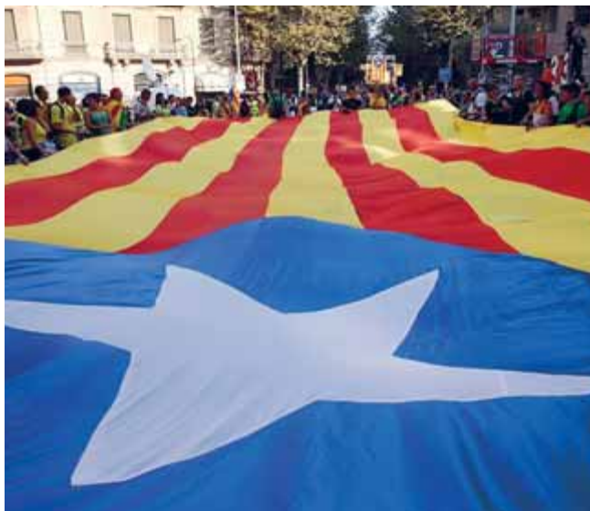
Una gran bandera estelada en la manifestació de l'Onze de Setembre de l'any passat a Barcelona

La Natació Catalana per la Independència, que s'ha donat a conèixer i està aprofitant el mundial de natació que es fa a Barcelona per fer pedagogia del país i dels seus símbols, i que contribueix a fer arribar al món la reivindicació de sobirania de Catalunya, seran els encarregats de portar l'estelada. Els ajuda-