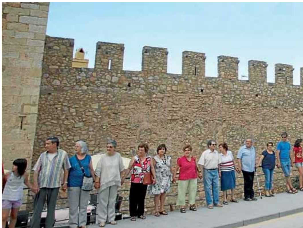
La cadena del 20 de juliol a Montblanc és una de les més espectaculars de les que ja s'han fet