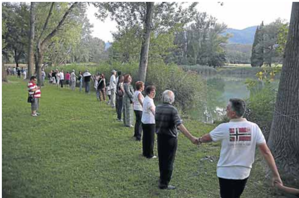
L'estanyol del Vilar de Porqueres va ser envoltat el 7 de juliol per un altre assaig de la cadena

món, en què es vol que surtin absolutament tots els participants.